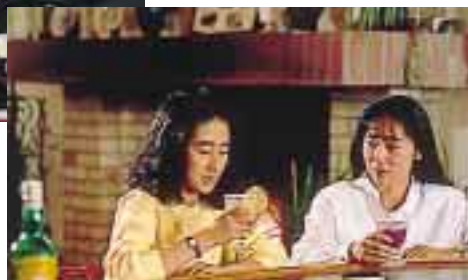
暖炉のあるラウンジバー