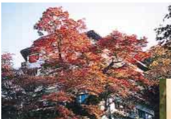
美しい紅葉に染まる秋