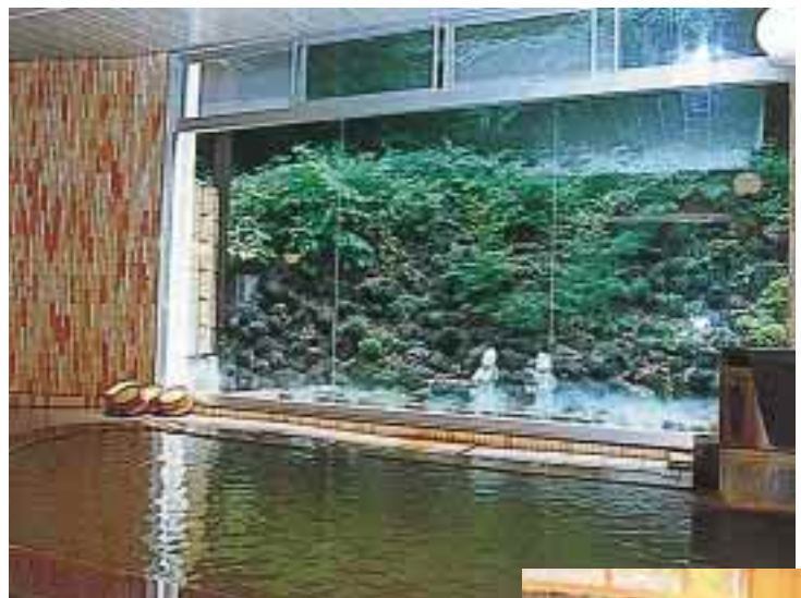
大浴場「石造り風呂」

すぐ近くの源泉から引いたお湯は泉質に優れ、サウナ付き檜風呂、スタンドグラスのある石造り風呂でお楽しみいただけます。