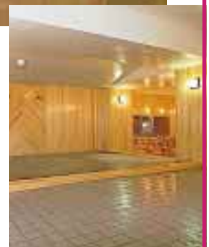
殿方大浴場 滝の音「亭主閣白の湯」