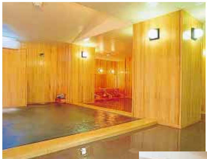
ご婦人大浴場滝の音「かかあ天下の湯」