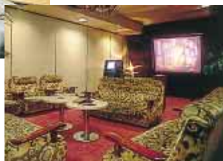
カラオケパーティールーム