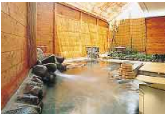
ご婦人露天風呂「風の声」