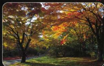
伊香保露天風呂、県立伊香保森林公園周辺なども紅葉の名所です。